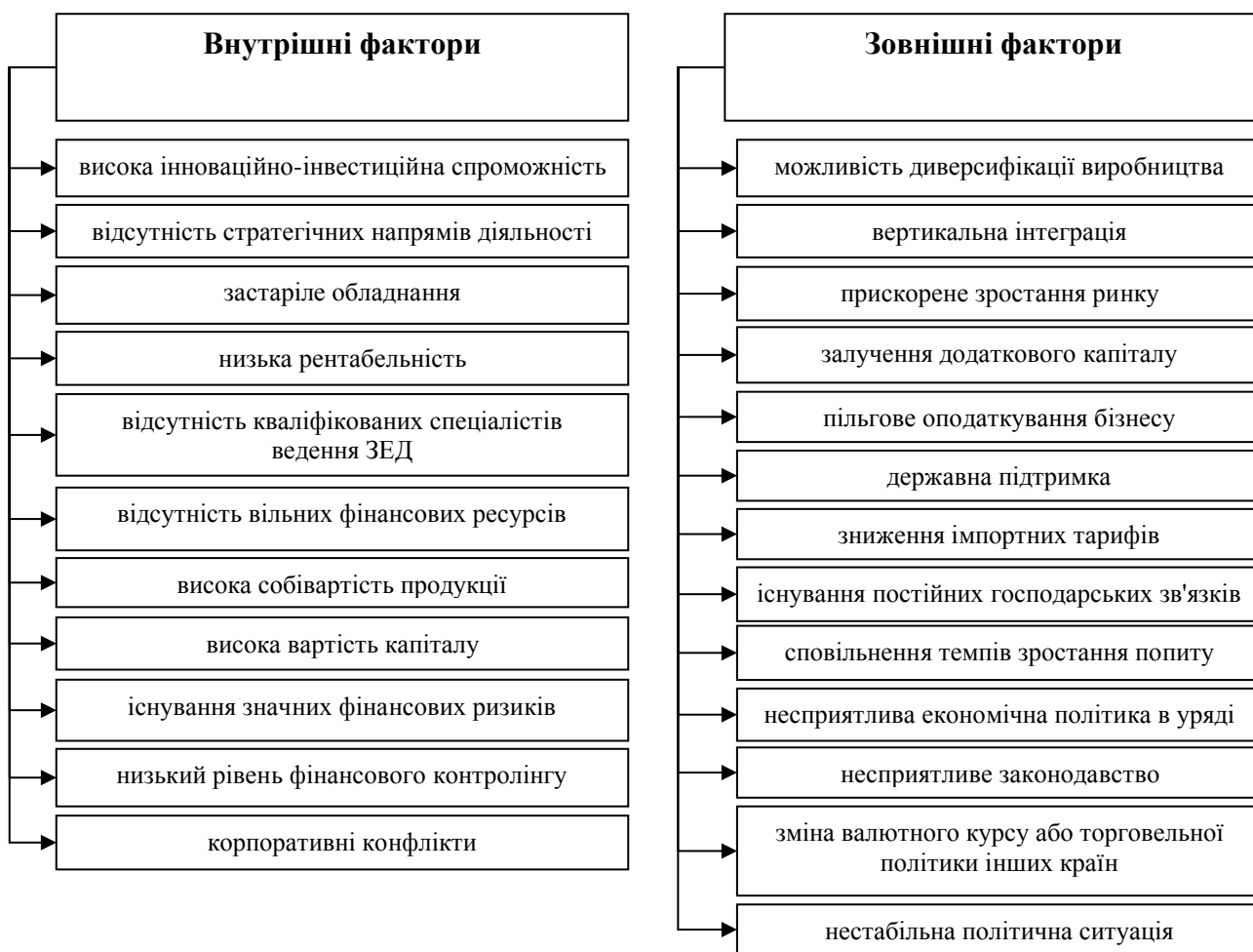
Рис. 1. Фактори впливу на розвиток імпортої діяльності підприємства

Таким чином, менеджери підприємств повинні враховувати всі проаналізовані чинники під час здійснення ЗЕД. Це дозволить їм успішно пристосовуватися до нестабільного зовнішнього та внутрішнього середовища, мінімізувати можливий негативний вплив даних факторів та створити правильну модель господарської діяльності, яка сприятиме підвищенню ефективності імпортних операцій підприємства.