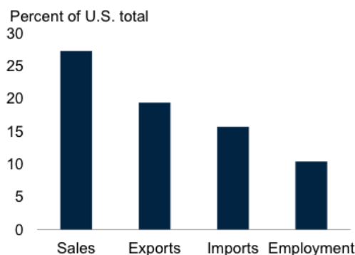
Рис. 2. Роль іноземних транснаціональних корпорацій у США (2017 р.)[6]

Американські ТНК становлять велику частку виробництва в США, впливають на зростання продуктивності праці, і їхня присутність на фінансових ринках велика. У свою чергу, іноземні транснаціональні корпорації, що працюють у США, забезпечують велику частку американської зайнятості та експорту (рис.2).