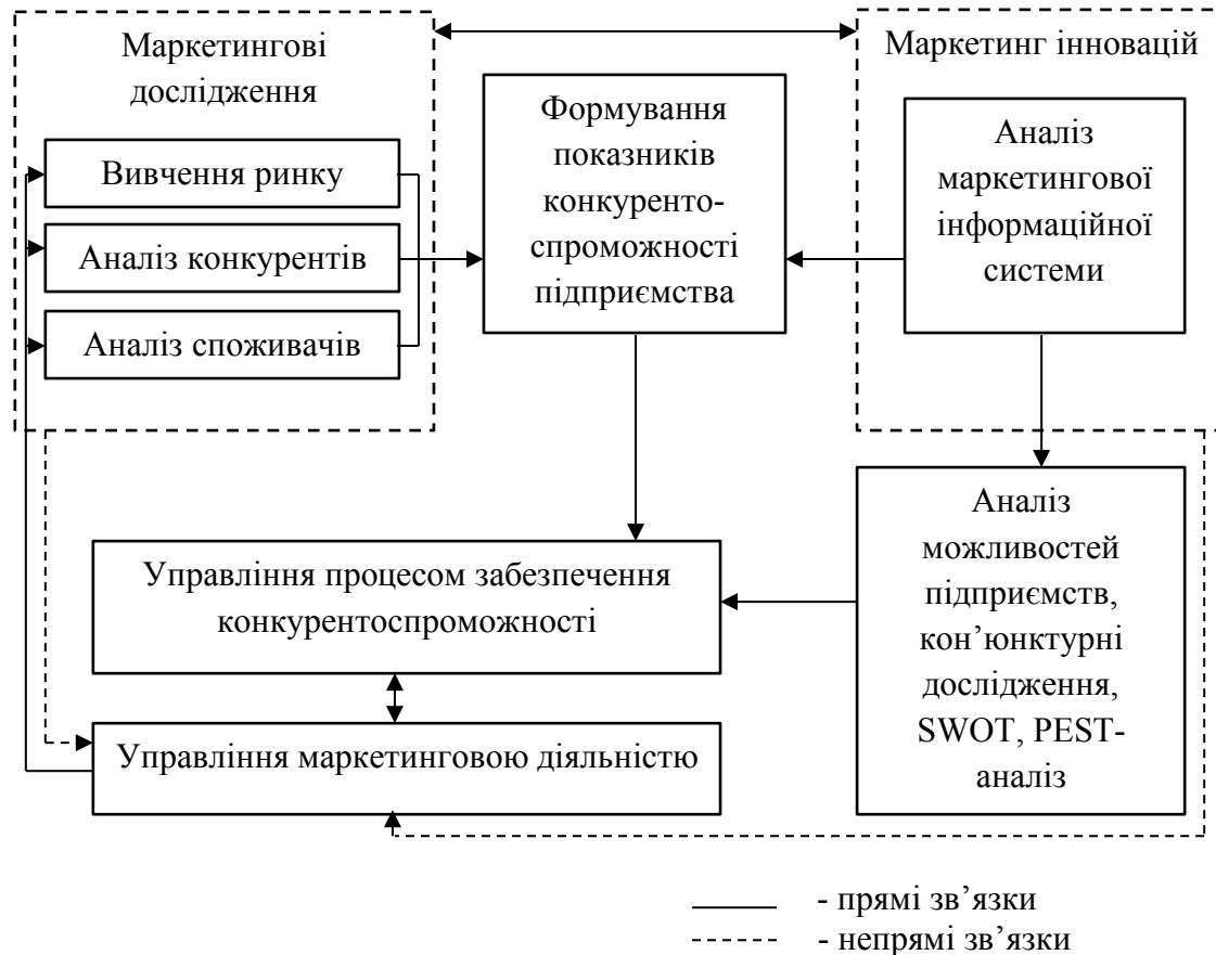
Рис. 3. Роль маркетингу в управлінні процесом забезпечення конкурентоспроможності [4, с. 237]

Роль маркетингу в управлінні процесом забезпечення конкурентоспроможності підприємства формалізована на рис. 3.