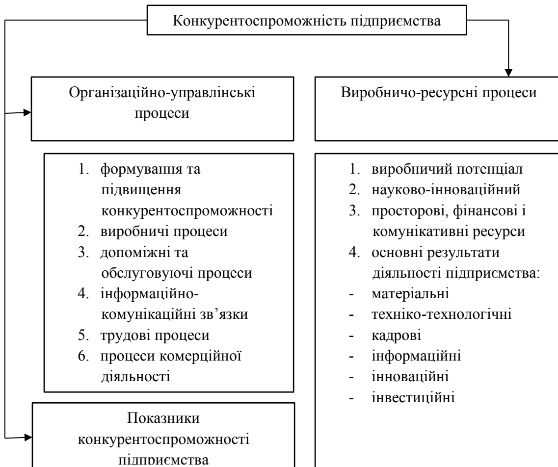
Рис. 1. Процеси і ресурси формування конкурентоспроможності підприємства [1, с. 68]

Формування і якісний вплив процесів створення конкурентних переваг потребує чіткого визначення функцій та завдань управління ними, їх створення на науково обґрунтованій методичній і аналітичній основі.