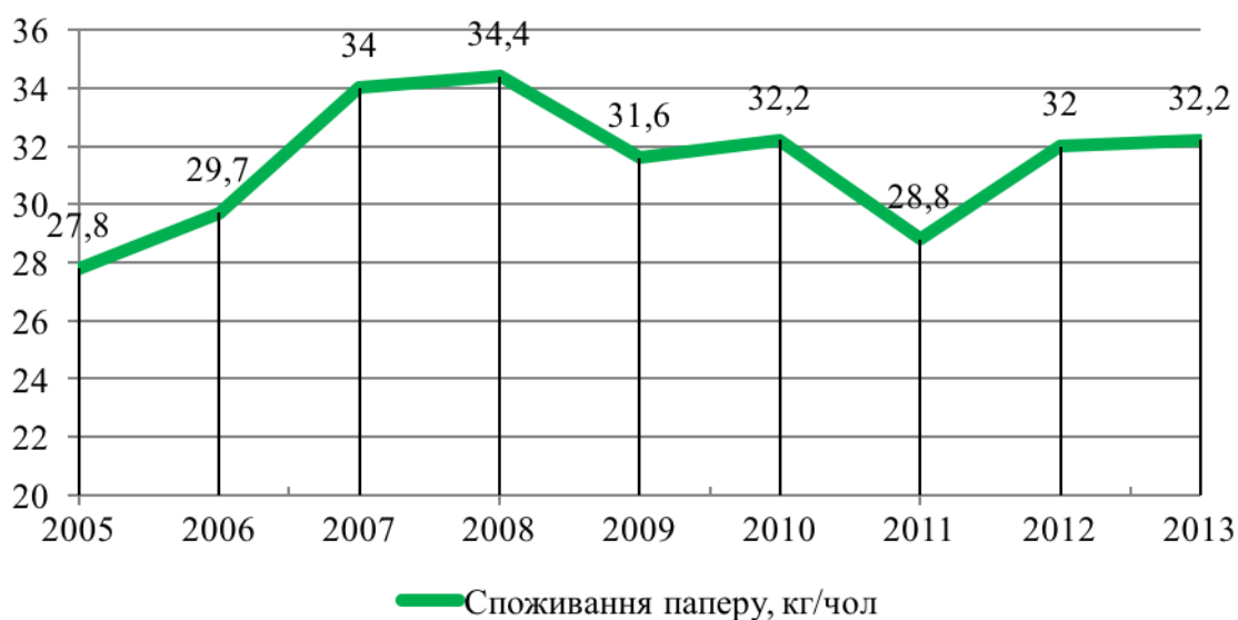
Рис. 1. Обсяги споживання паперу в Україні, кг/чол

Саме через це, задля успішного розвитку, ринок целюлозно-паперової промисловості потребує доволі активної підтримки з боку держави. В багатьох країнах світу даному питанню приділяється велика увага, що відображається в показниках споживання паперу на душу населення, який в свою чергу є складовою рівня розвитку населення, їхньої екологічної та соціальної захищеності. Станом на 2013 р. за даними Всесвітньої організації «Pulp and paper Products Council» на одного громадянина України припадало 32,3 кг паперу на рік, при тому, що середньосвітова норма цього показника перевищує 70 кг на рік, зокрема в Західній Європі – 250 кг, в Японії – 250 кг [5].