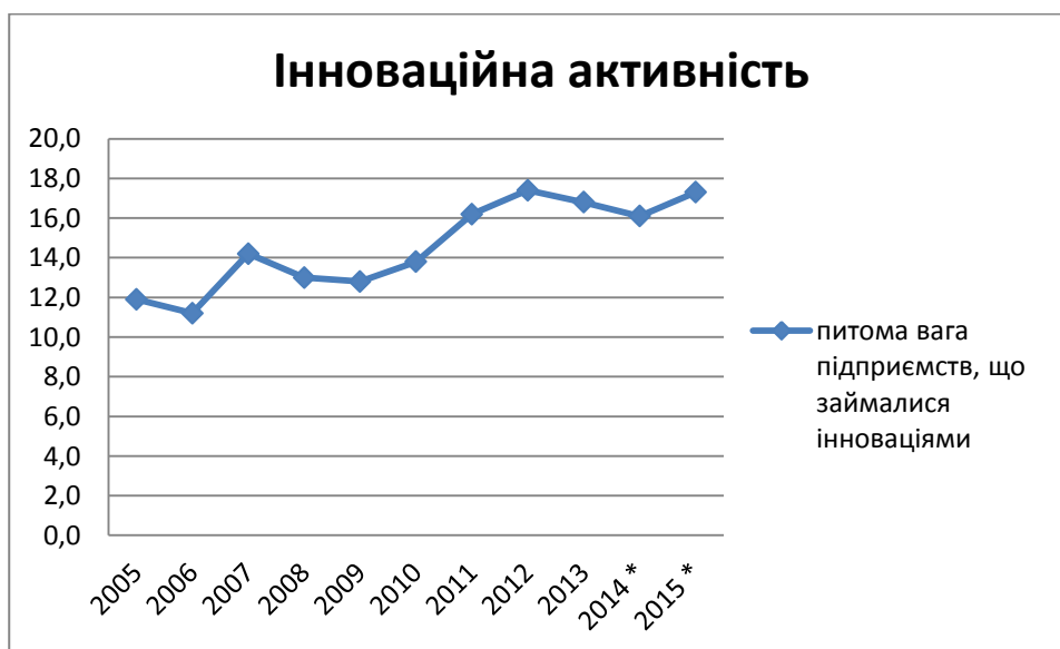
Рис. 2. Інноваційна активність підприємств

Проте, не дивлячись на доволі слабку підтримку з боку держави, інновації на підприємствах впроваджуються з кожним роком усе більше.