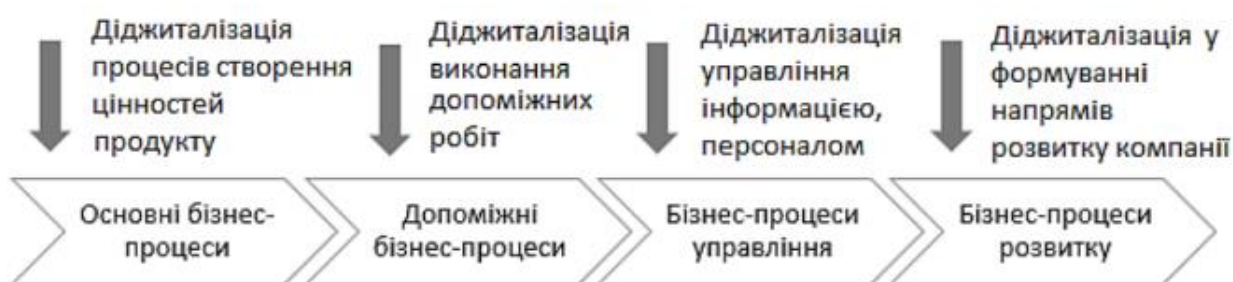
Рис. 2. Місце діджиталізації серед моделі виконання бізнес-процесів [4]

Коментуючи свою схему, автори стверджують, що діджиталізація бізнес-процесів дозволить менеджерам легко контролювати якість виконання всіх етапів змін на підприємстві. Дане твердження є справедливим, оскільки необхідно аналізувати діяльність підприємства і виявляти необхідність впровадження нововведень, або навпаки зрозуміти, що дане нововведення потребує додаткового часу або ресурсів. Це мінімізує часові та матеріальні витрати підприємства [4].